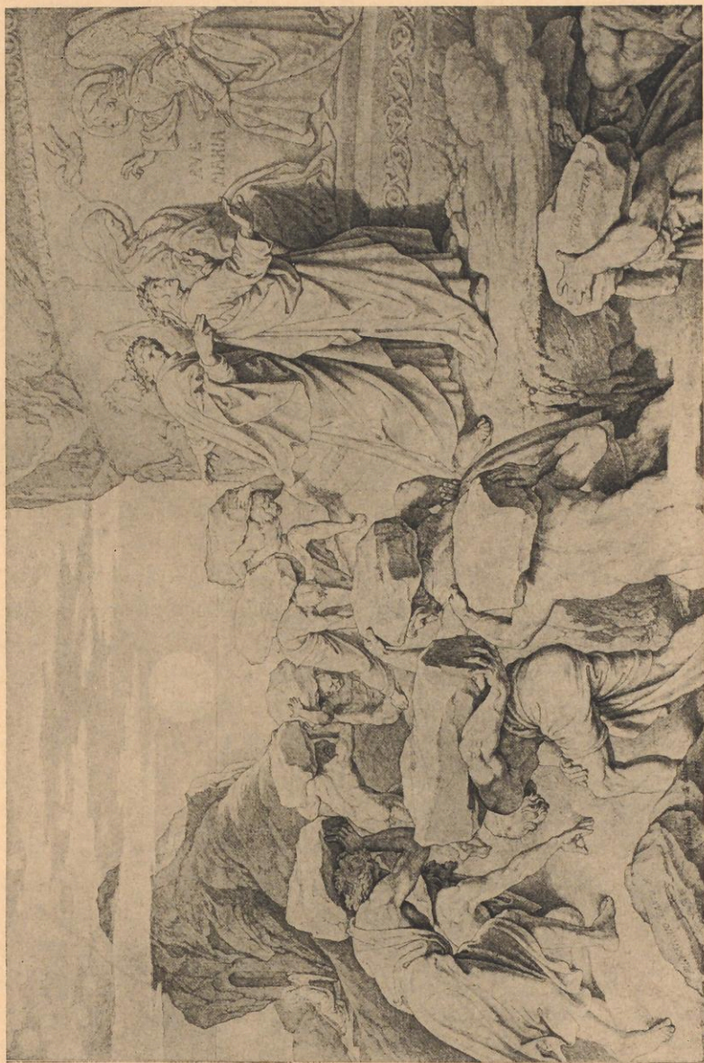
Joseph v. Führich, Bleistiftzeichnung zu Dante, Purg. X u. XI: Strafe der Stolgen.